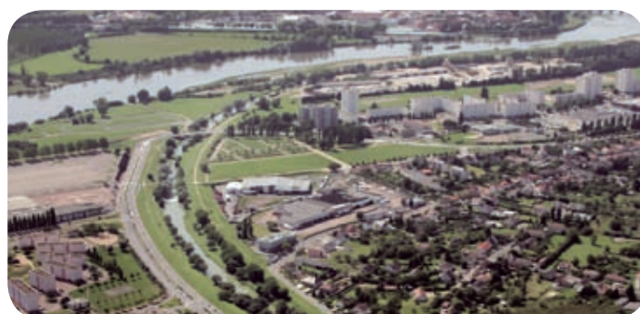
La Loire, le canal de la Nièvre et le quartier du Mouësse