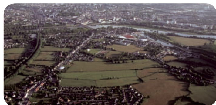
Le val de Sermoise et Nevers

Sur le val de Nevers, la modélisation détaillée 2D, comme la modélisation globale 1D, calcule les impacts des scénarios des aménagements destinés à réduire les aléas inondation. Il est donc possible d'évaluer et de quantifier l'intérêt de chaque proposition d'aménagement ou des combinaisons d'aménagements.