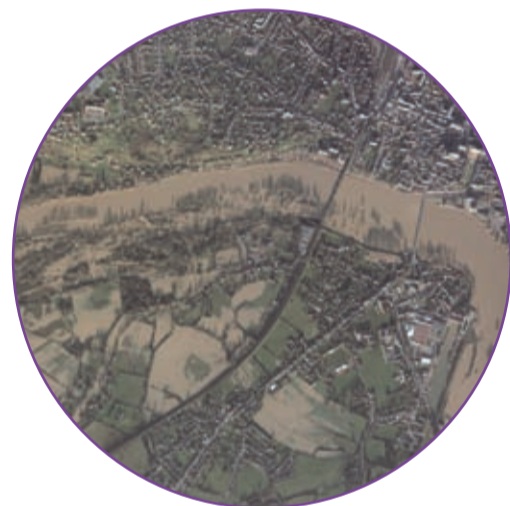
La crue de décembre 2003. Orientation de la photo différente de la modélisation