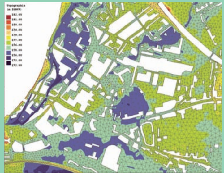
Les formes blanches matérialisent le bâti à travers lequel il n'y a pas d'écoulement